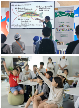
がぞうさんしょう ようす 画像参照：イベントの様子 かぶしきがいしやホームページ