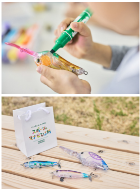
がぞうさんしょう いろ ようす 画像参照：ルアーと色ぬりの様子 かぶしきがいしいや

自然 しぜん の中 なか には、たくさん まな の学 はっけん びや発見 しげん がくれています。たとえ、自然 しぜん の中 なか で行う魚 おこな つり。ただ魚 さかな がはりにかかるのを待 まち っているだけのように見えても、いろいろう工夫 くふう をするおもしろさがあり、たくさん ひと の人に親 した しまれています。そこで、魚 さかな つりを通 とお して子どもたち こ に自然 しぜん の奥深 おくふか さと楽し たの さを伝 つた えているのが、つり具 ぐ とスポーツ用品 ようひん をつくる会社 かいしゃ 「グローブライド株式 かぶしがいしゃ 会社 かいしゃ 」です。その取組 とくぐみ みのひとつとして、「自然 しぜん を知 し り、考 かんが える」ことをテーマにした体験イベントを行っています。イベントでは、先生 せんせい の話 はなし やクイズ くいず を通 とお して、魚 さかな のことを知 し り、どこに行 い けば会 あ えるのか、どんなエサがす す きなかなどを学 まな んでいます。魚 さかな が好 この む場所 ばしょ や食 た べもの、魚 さかな つりにぴったりな天気 てんき や水 みず の流れ なが 、水温 すいおん など、魚 さかな つりを通 とお じて自然 しぜん のしくみを知 し る中で、「おもしろい！もっと知りたい！」という気 き もちが生ま う れます。