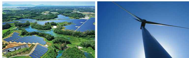
画像参照：太陽光発電所と風力発電所の写真(リエネHPより)

太陽の光や風の力など、自然にあるエネルギーを「再生可能エネルギー」といいます。再生可能エネルギーは、石油や石炭などの化石燃料とは違って無くなることなく、地球温暖化の原因になる二酸化炭素もほとんど排出しません。そのため、環境にやさしいエネルギーとして注目されています。石油や石炭などの資源が減っている問題から、今、世界中で再生可能エネルギーの利用が進んでいます。すでに太陽光発電や風力発電は多くの国で使われており、今後さらに技術が進むことが期待されています。