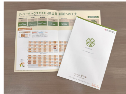
画像参照：マンション家計簿・イメージ画像 (三菱地所レジデンス・プレスリリースより)

マンションを購入する際にはこれまで、広さや見晴らし、周辺の環境などが重視されてきました。しかし現在では社会全体でSDGsへの関心が高まる中、「どれだけ環境にやさしいか」を示す「環境性能」も重視されつつあります。マンションなどの住まいをつくる会社「三菱地所レジデンス」では、「ザ・パークハウス」というマンションの購入を検討している人に、「マンション家計簿」という冊子の配布を2013年にスタートしました。