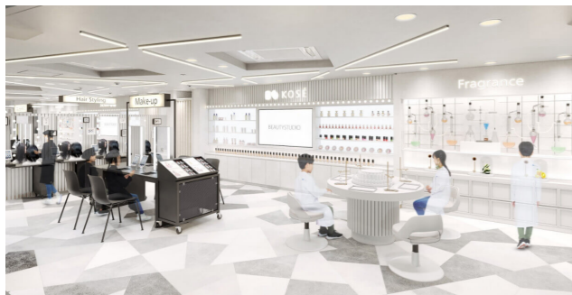
画像参照：「ビューティスタジオ」イメージ

化粧品会社のコーセーでは、「化粧品・美容は大人の女性のもの」という従来の考え方ではなく、子どもたちに向けても、化粧品に関わるさまざまな取り組みを行っています。そのひとつが、子どもたちが職業体験できる施設「キッザニア東京」で運営しているパビリオン「ビューティスタジオ」です。この「ビューティスタジオ」では、「きれいを、もっと自由に」をテーマに、子どもたちがそれぞれ持つ感性を育み、「きれい」にまつわる多様な価値観に触れながら、化粧品や美容が持つ、心を明るくするような楽しさや、わくわく感を得られる職業体験を提供します。