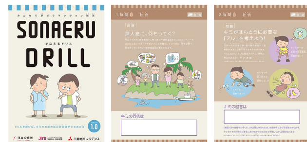
がどうさんしょう 画像参照：「そなえるドリル」の使い方・ダウンロード （三菱地所レジデンスHPより）

地震や津波などの災害に備えて、みなさんの学校でも避難訓練をおこなっていると思います。災害はいつ発生するかわかりません。日頃からきちんと準備しておくことが大切です。そこで、マンションなどの住まいを作る会社「三菱地所レジデンス」では、たくさんの人が安心・安全に暮らせるように、「そなえるドリル」という防災ツールを作りました。「そなえるドリル」とは、子どもと大人が家族を想定して考える防災ツールで、「災害時の困ったこと」を伝えながら、防災の備えをしょうかいしています。家族と相談しながら問題を最後まで解くと、家族のぼうさいけいかくしょが完成します。この「そなえるドリル」は、インターネットからでも手軽に見られるので、ぜひ検索してみてください。